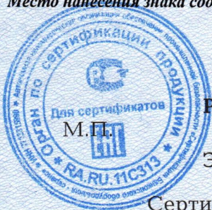
Схема сертификации 1с

Место нанесения знака соответствия: сопроводительная техническая документация и этикетка